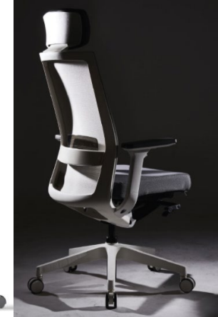
design JOYN (CHO YOON HA)의 작품 중